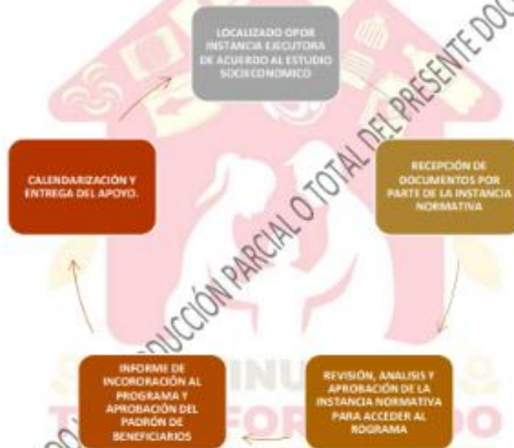
Figura 2. Dinámica de Entrega del Programa.